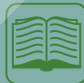
Aivar Kriiska. Aegade alguses: 15 kirjutist kaugemast minevikust. 2004.

Võimalik, et tolle kaugel aja mentaliteedist ja erksast loodustajust on üht-teist kandunud tänapäevagi. Näiteks tänini mäletatakse rahvalaulu valgest jänese, milles kajastub ürgne uskumus, et jahil tapetud looma kondid tuleb metsa tagasi viia, siis saab neist uus loom.