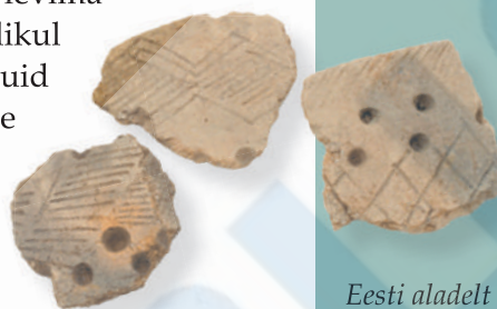
Eesti aladelt leitud kammkeraamika killud (u 4000–2000 eKr).

Umbes 4000 aastat eKr hakkas Eestis levima kammkeraamika kultuur, kasvades loomulikult välja eelmisest, st Narva kultuurist, kuid seekord tuleb arvestada võimalust, et peale ideede ja moe tuli Eestisse ka suuremal hulgal sisserändajaid. Nad võisid tulla selleks ajaks nüüdseks ammu jääst vabanenud Karjalast (mis paistab olevat uue kultuuri üks kesksemaid alasid) või kusagilt Volga jõe ülemjooksult.